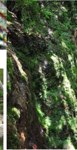
2 Marmite du sanglier