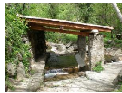
6 Le lavoir