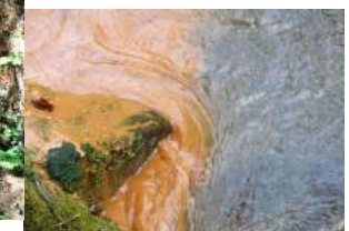
1 Source ferrugineuse