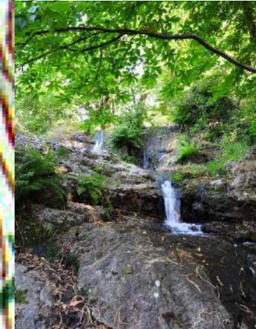
5 Cascade double du dragon de l'Espinouse