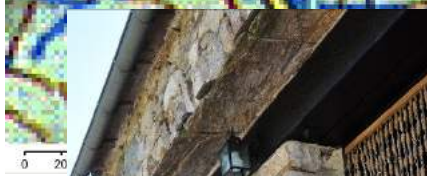
7 Hameau de Mauroul